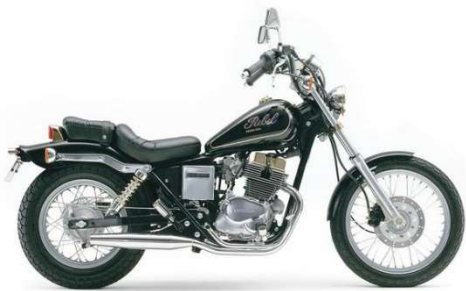
一番長く乗ったレブル