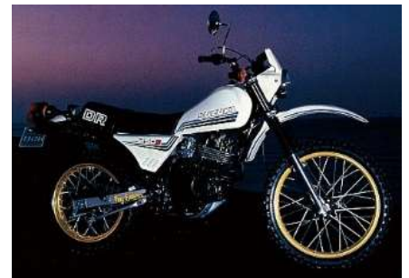
一番最後に乗ったジェベル