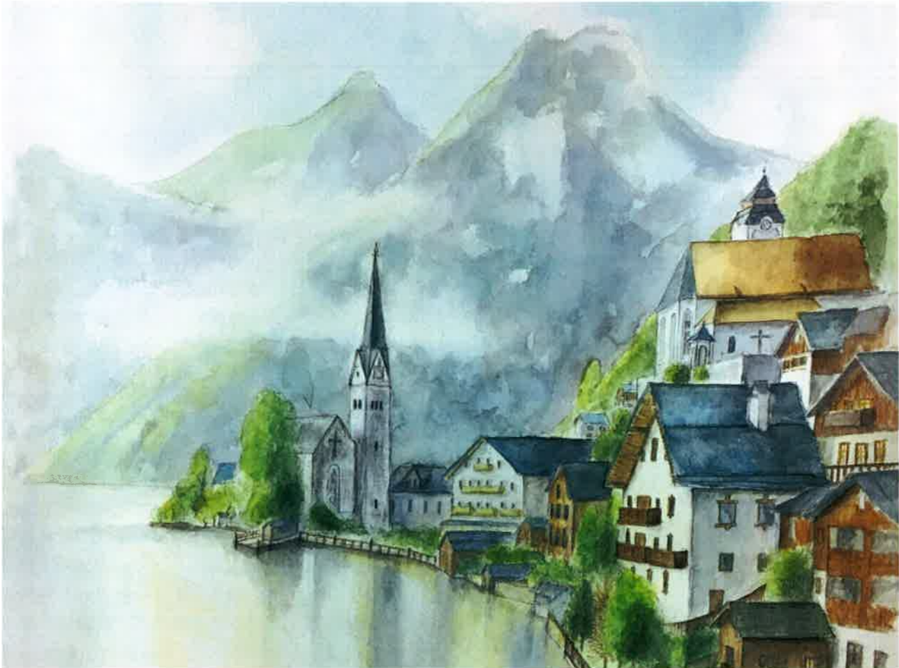
(「湖岸の町」オーストリア・ハルシュタット 画：星野瞳)